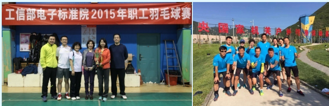
图 22 赛西认证参加总部活动

关心员工身心健康，开展多样活动，将工作、学习和活动融合在一起。针对公司出差任务繁重的特殊性，建立微信群，保证了工作效率，又使长期在外的同事感受到集体温暖；引导员工积极参加体育锻炼，利用运动手环、微信运动等功能组织健步走比赛，既强身健体又活跃气氛；积极开展各项文化娱乐活动，参加院里组织的篮、排球比赛、羽毛球比赛等，在2015年院羽毛球比赛中获得季军；积极选派青年人参加工信部拓展比赛选拔，代表工信部参加中央国家机关运动会；对业余时间坚持锻炼的年轻人给予鼓励，宣扬倡导其他员工学习他们这种精神；利用周末时间组织大家登山健身。各项活动得到员工的积极响应，在自娱自乐的同时增强团队合作意识和集体荣誉感，增加员工归属感，营造和谐内部环境。