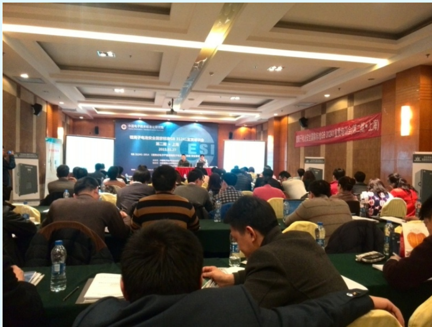
图 19 上海举行“锂离子电池安全国标 GB31241 宣贯培训会”

锂离子电池安全认证工作的开展促进了锂电池行业整体水平及产品安全质量的提高，起到更好地保护消费者人身健康安全的作用，为市场营造良好的竞争秩序。