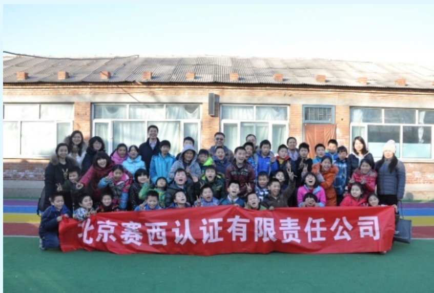
图 31 志愿者代表和师生代表合影