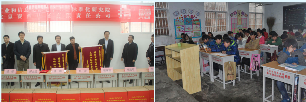
图 28 北京赛西认证有限责任公司在汝阳县开展捐赠活动

仪式结束后，领导还深入到小店镇小寺村贫困户家中进行慰问，为他们送去了米、面、油等物品。