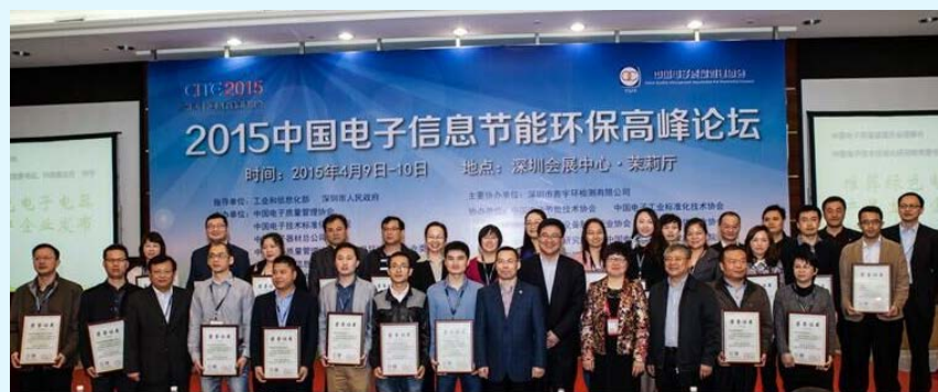
图 24 北京赛西认证与中电质协联合发布绿色电子产品生产企业证书

2015年4月，为推广绿色制造，我公司与中国电子质量管理协会联合评选了100余家“绿色电子电器产品生产企业”，并在共同举办的“2015中国电子信息节能环保高峰论坛”时为上述企业颁发荣誉证书。