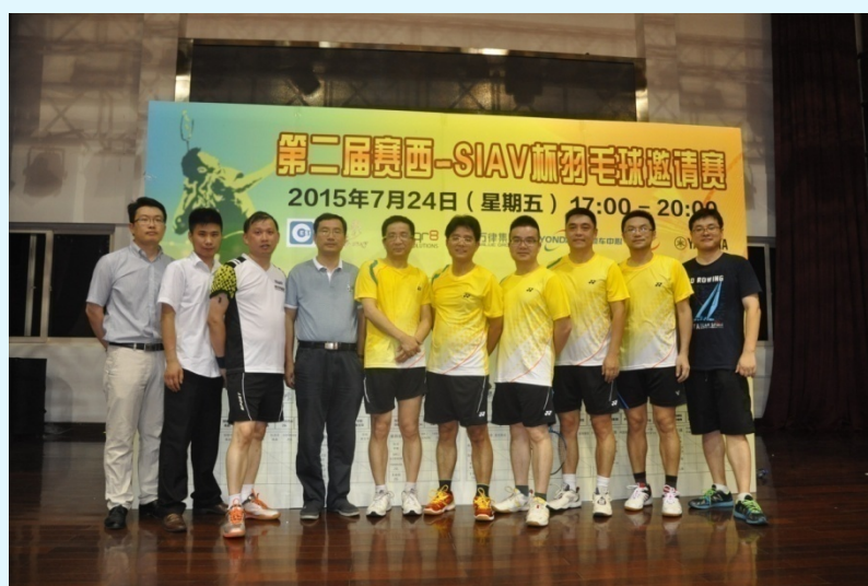
图 23 赛西上海分公司举行第二届赛西-SIAV 杯羽毛球邀请赛