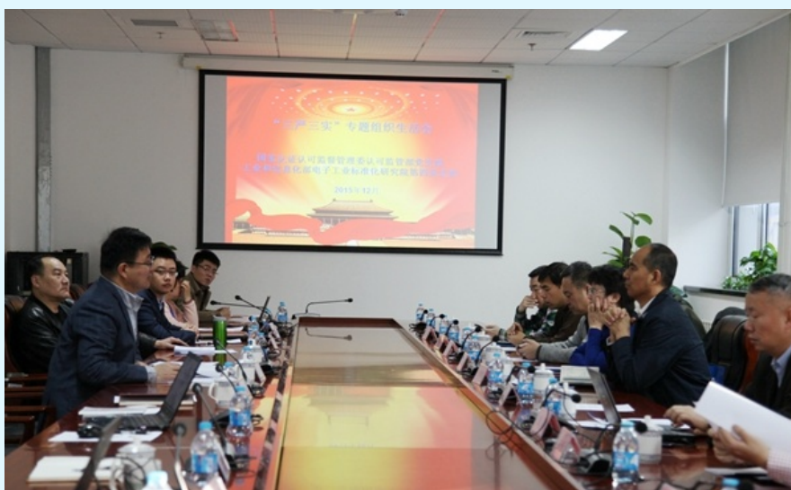
图 6 与国家认监委认可监管部党支部召开“三严三实”专题组织生活会

双方党支部分别介绍了各自党建及业务工作开展情况，学习了《中国共产党廉洁自律准则》、《中国共产党纪律处分条例》，并结合认证认可工作实际，针对认证市场竞争和监管、认证机构业务领域和分支机构拓展、高新技术企业认定等具体问题进行了深入探讨。同时，院领导陪同国家认监委领导参观了赛西认证的党建学习园地和精神文明建设展览。