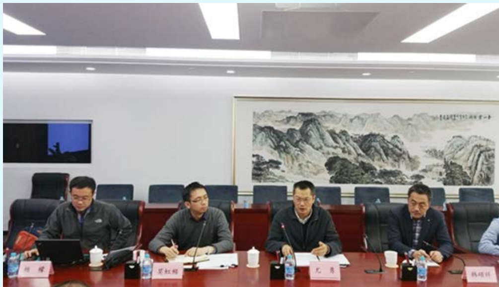
图 16 北京赛西认证有限责任公司介绍绿色工厂创建工作方案

支撑工业和信息化部召开“绿色工厂创建工作研讨会”、“‘十三五’规划编写座谈会”以及专项研讨等方式,征求工信部机关、行业专家、骨干企业关于《绿色工厂创建实施方案》的意见,并根据反馈意见对相关文件多次完善。