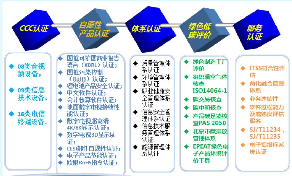
图 2 赛西认证主要业务范围图