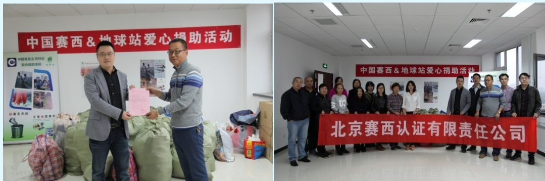
图 32 通过“地球站”公益创业工程进行爱心捐助

一件旧棉衣，一双旧棉鞋，对身居城市的人来讲，也许只是压在箱底的负累，但对生活在贫困地区的儿童来说，这些旧衣物就像冬日里的阳光，让他们感受到温暖。活动开展过程中，倡导者、联系人、衣物收集人都是志愿服务，大大提升了职工的参与度、服务意识和利他精神。同时，公益活动努力实践“节约、环保和慈善”，旨在推行循环经济、垃圾减量、物尽其用的环保理念。