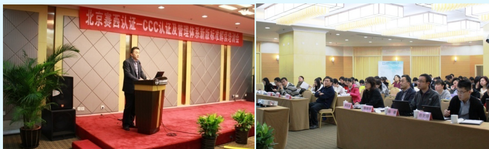
图 9 北京培训会议现场

2015 年 9 月 23 日上海分公司组织上海区域 GB/T19001-2015 新版标准培训。