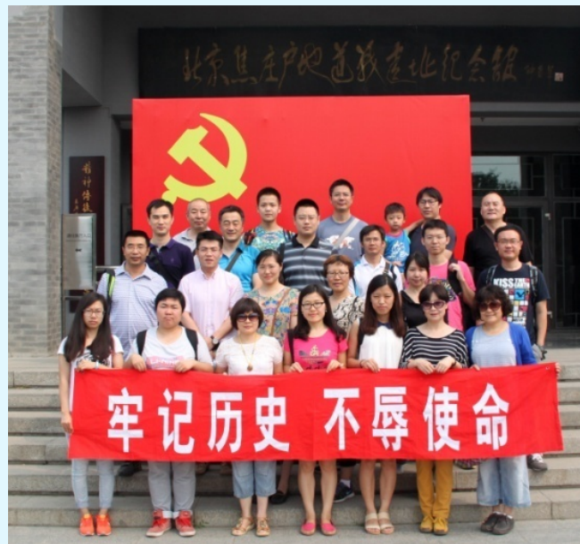
图 8 赛西认证到焦庄户地道战遗址纪念馆参观学习