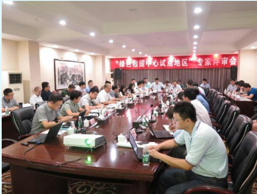
图 13 支撑召开“绿色数据中心试点地区”评审会