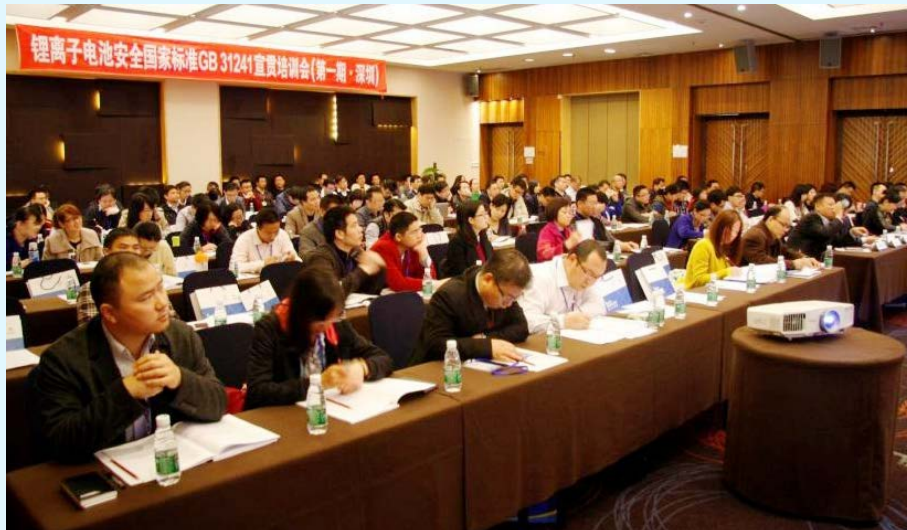
图 17 锂离子电池安全国家标准培训会议现场