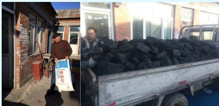
图 29 赛西认证向燕京小天鹅学校捐赠物资

赛西认证每年都定期了解学校的现状，针对需求提前准备，希望真正能从实处为学校提供帮助。今年了解到学校每天做饭、单孤学生住宿等需要消耗大量米面，校舍的简易房过冬急需取暖用煤，公司提前与基金会联系，将部分捐助款项直接为学校购买米面、煤等必需品。