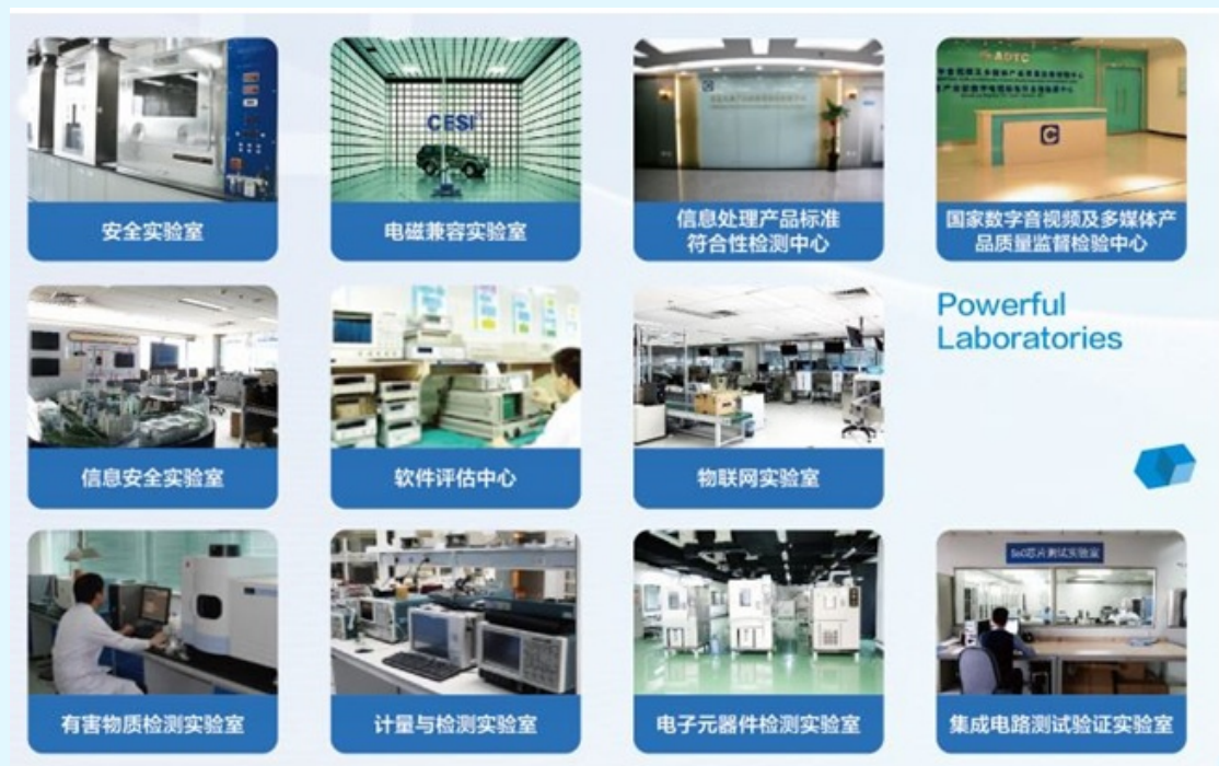
图 3 CESI 实验室