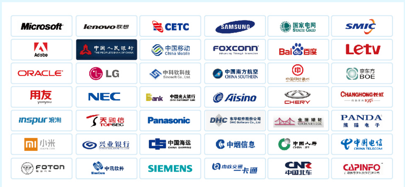
图 4 赛西认证部分客户展示