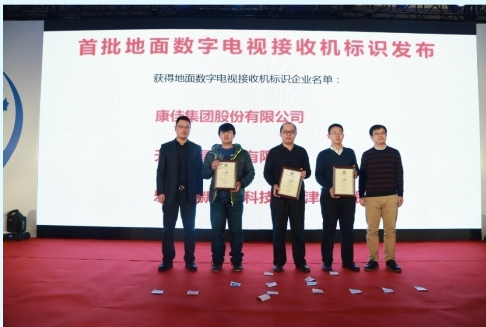
图 14 工业和信息化部电子司和我公司共同颁发首批“地面数字电视接收机标识”

作为工业和信息化部委托机构，支撑部电子司开展地面数字电视接收机标识管理工作，制定并发布标识管理工作程序、要求等文件；按时完成标识申请受理、审核，9 家企业通过认证，2 家通过标识审核；建设标识管理信息系统，运行标识网上申请；建设公共服务平台，开展政策普及及宣传。