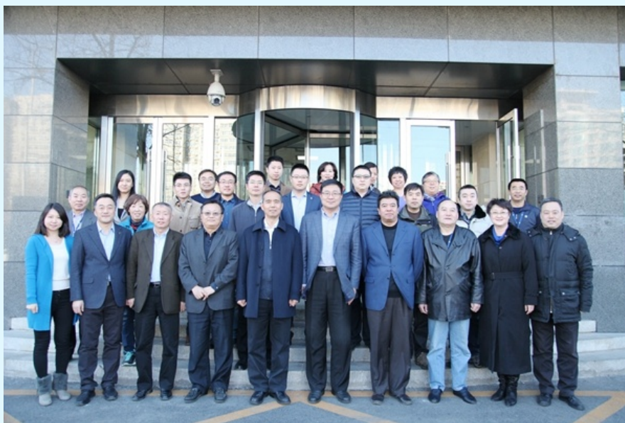
图 7 与国家认监委认可监管部党支部合影