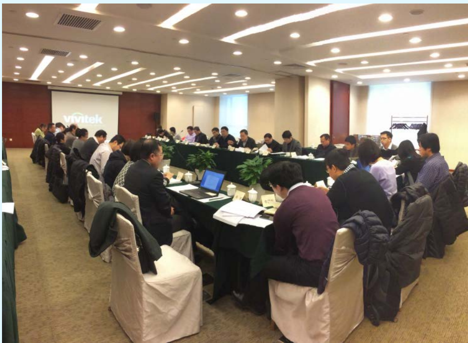
图 15 工信部工业节能与综合利用标准化工作座谈会

承担了工业和信息化部《绿色制造标准体系建设指南》的编制工作，以服务和支撑《中国制造 2025》中全面推行绿色制造的重点任务为目标，以工业和通信业节能与综合利用领域标准体系建设基础，结合各行业绿色制造需求，研制《绿色制造标准体系建设指南》，建立了以绿色产品、绿色工厂、绿色园区、绿色供应链、绿色企业为核心的绿色制造标准体系，研究提出了“十三五”时期我国绿色制造综合标准化实施方案，该文件是指导我国“十三五”绿色制造标准化工作的最重要顶层设计文件。工信部工业节能与综合利用标准化工作座谈会中对《绿色制造标准体系建设指南》进行了重点讨论。