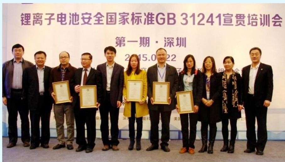
图 18 首批获得认证证书的企业代表与颁证领导合影

随后，上海分公司于 2015 年 1 月 27 日在上海举行“锂离子电池安全国标 GB31241 宣贯培训会”。