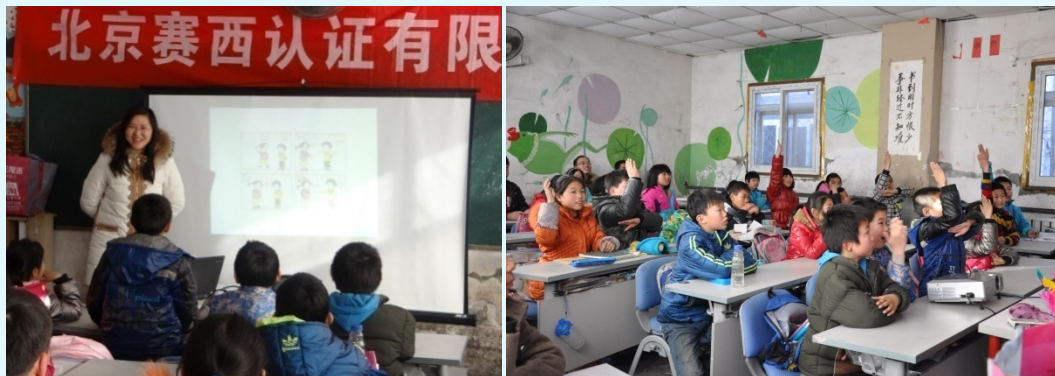
图 30 志愿者公益讲座课堂现场

每次讲座都采取图文并茂的方式，教授孩子们日常生活中环保知识和安全知识，详解环保和安全对生活的重要作用，帮助孩子们解析在日常生活中的环境保护常识和行为模式背后隐藏的安全问题。讲座深受孩子们的欢迎，课堂气氛活跃，每场讲座的互动环节，孩子们都会与志愿者展开热烈讨论。