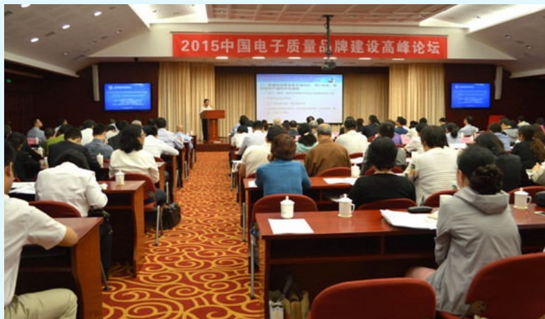
图 25 电器电子产品污染控制成果案例发布

2015年6月，我公司与中国电子质量管理协会再次联合，征集电器电子产品污染控制成果案例，经筛选收录入成果案例汇编，并于2015年质量月期间的“2015年电子质量品牌建设高峰论坛”上发布评选结果，对优秀案例给与表彰，同时在中国电子质量网和我公司官网进行公布和推广。