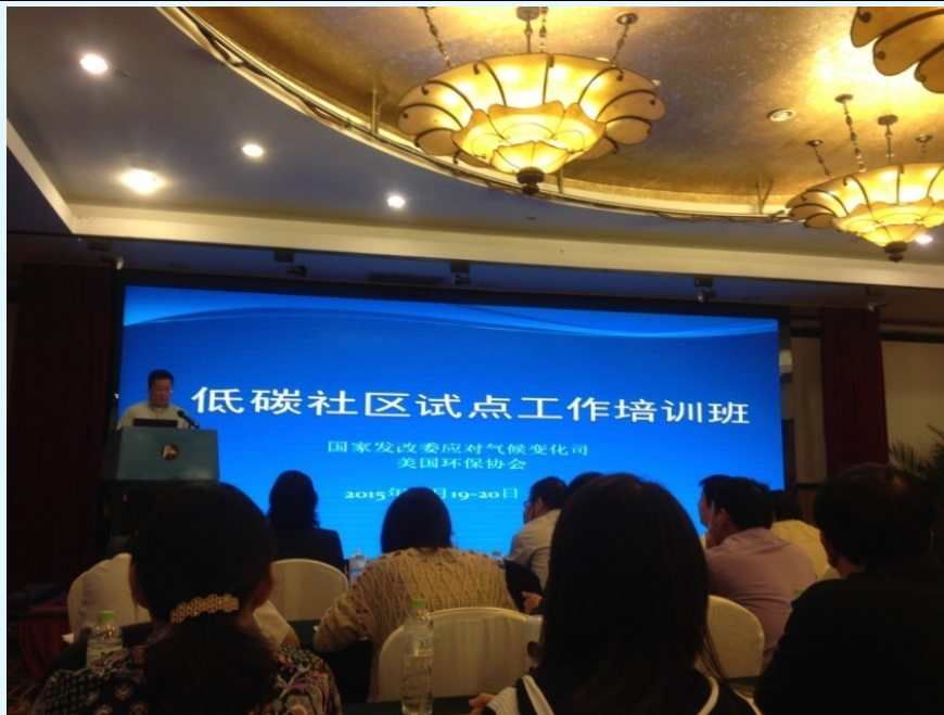
图 21 上海分公司参与低碳社区相关工作

2015年6月20日，赛西认证参加上海市发改委组织的低碳日活动，上海分公司承接两家社区建立低碳社区的指导工作。