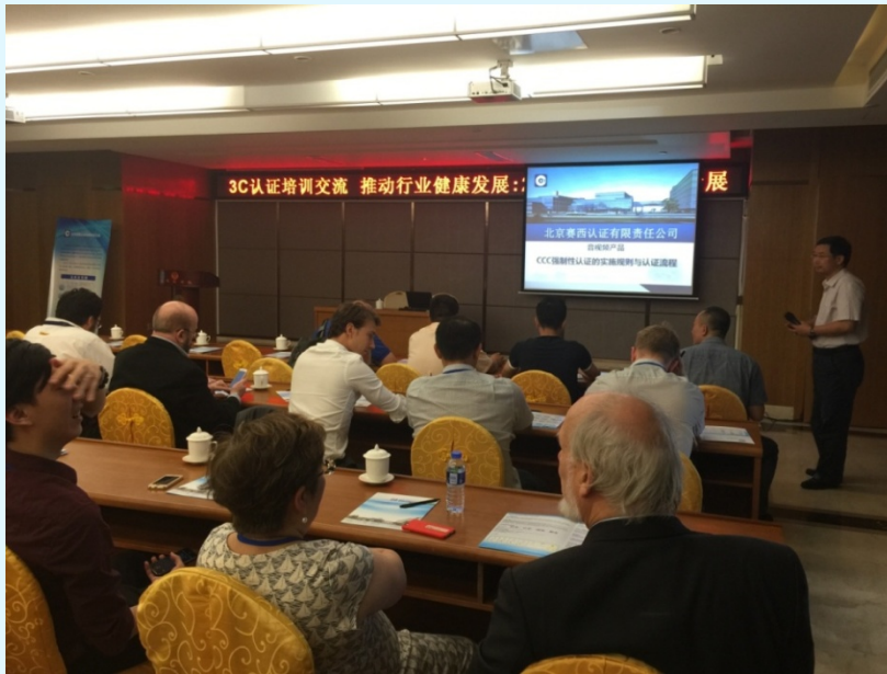
图 10 广东汕头高级视听展上向来自国内外厂家介绍“音视频产品的 3C 认证”的专题交流