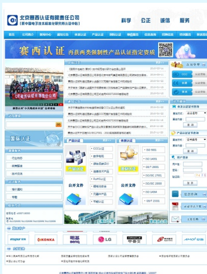
图 27 赛西认证网站