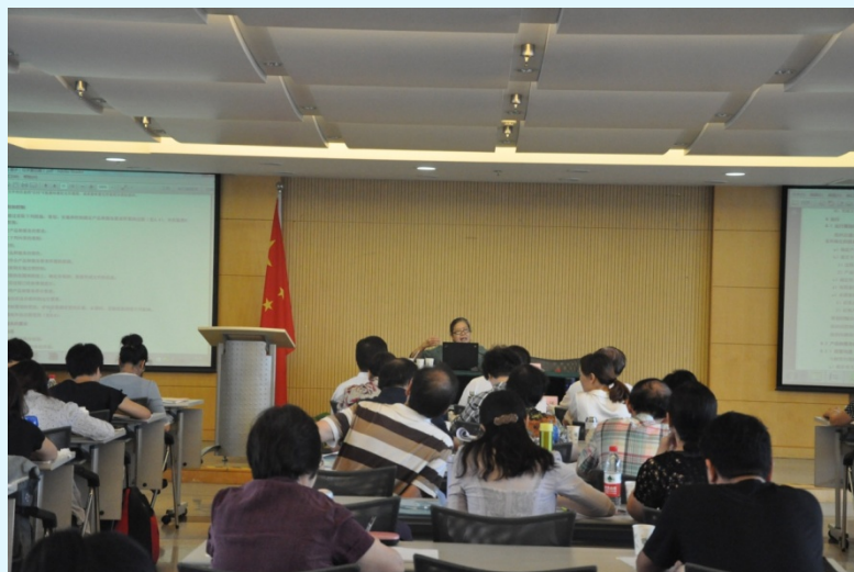
图 11 上海分公司新版标准培训现场