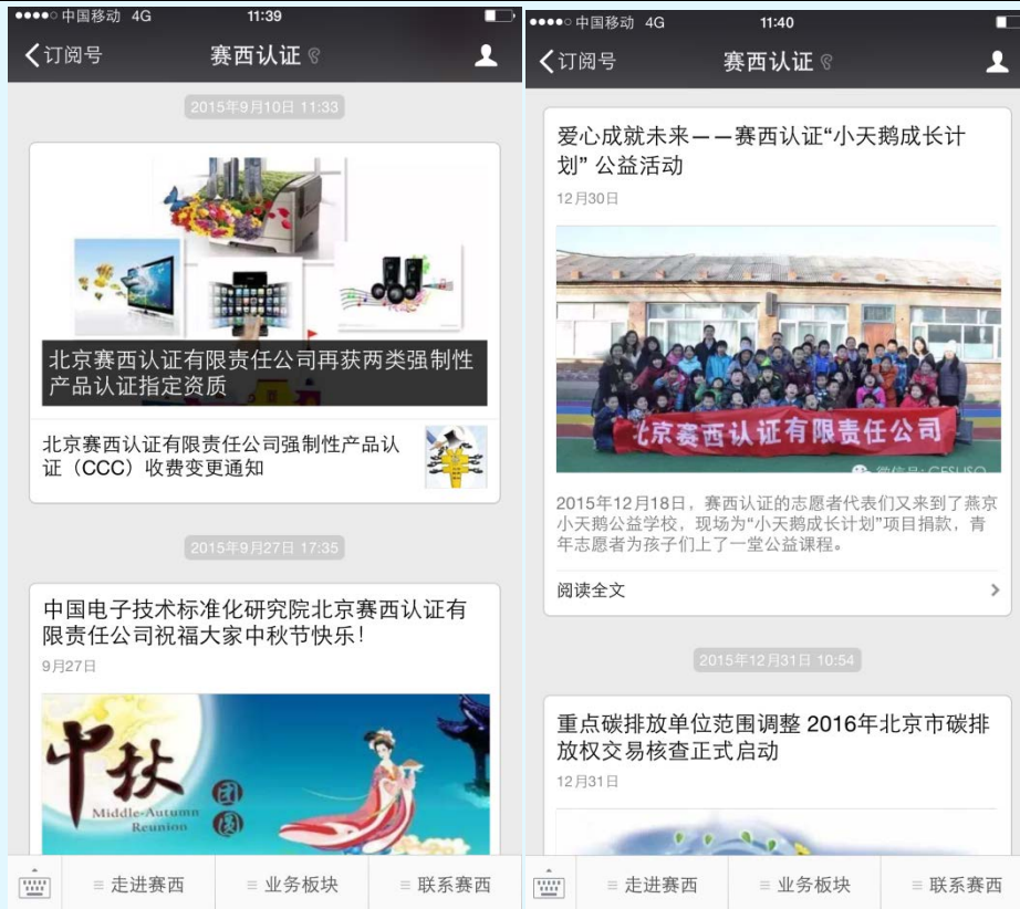
图 26 赛西认证微信平台